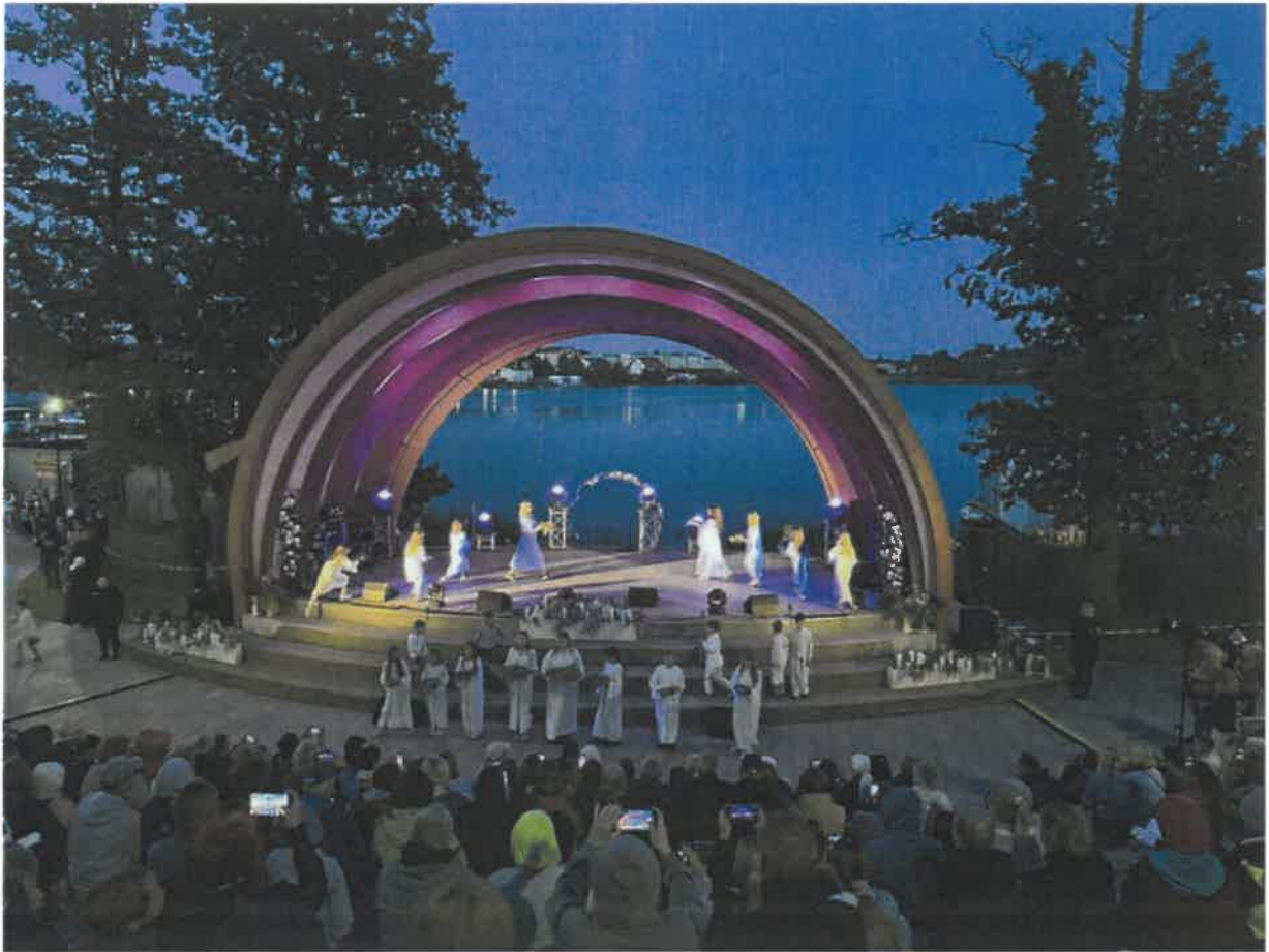
Eksplzja kolorów i imprezka z Radiem Eska