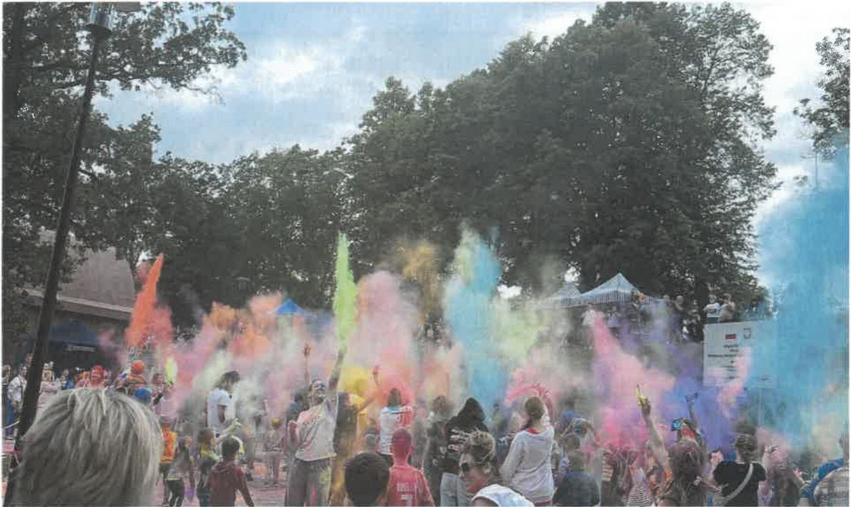
Festiwal 5 Zmysłów